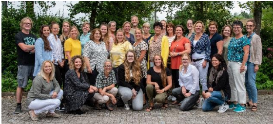
Gezamenlijke studiemiddag op 29 augustus jl. Team Zevensprong en Team Immanuël